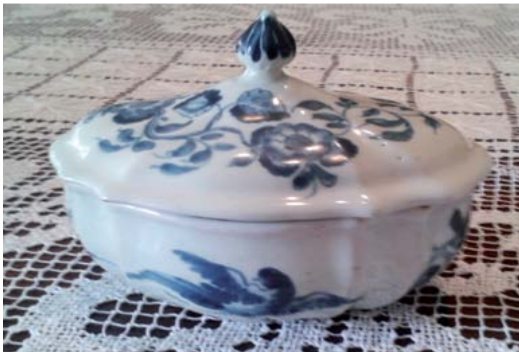
Fig.5. Zuccheriera con coperchio (Bologna, collezione privata).