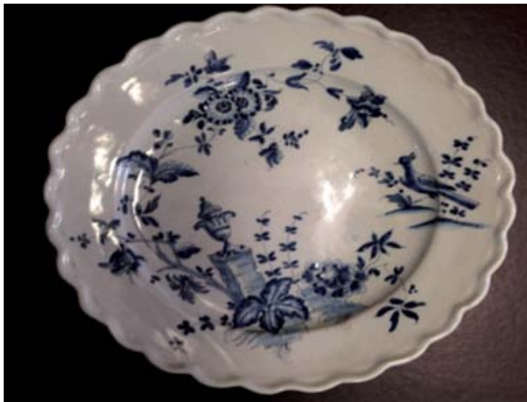
Fig.3. Vassoio poli-lobato (Collezioni d'Arte e di Storia della Fondazione Cassa di Risparmio in Bologna) - Autorizzazione del 7 settembre 2016.

alta frammentarietà, solamente con un inconfondibile disegno (2) (Fig.2). Si trattava di un coperchio di una zuccheriera fregiata in monocromia azzurra su fondo