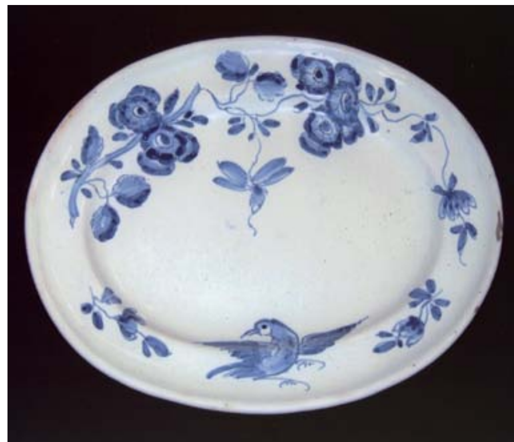
Fig.8. Vassoio ovale (Bologna, collezione privata).

Non sono mancati in questi anni gli studi e le mostre (10) dedicate alla maiolica bolognese del Settecento. E il ritrovamento di inediti esemplari rimane sempre un evento degno di essere segnalato e commentato.