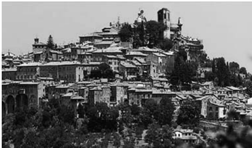
Fig.2. Sulle colline di Amelia, Comune in provincia di Terni (Umbria), sorge il “Romitorio”, dove si svolse nel 1997 il “Progetto intergenerazionale: le radici e le ali” della durata di cinque giorni.