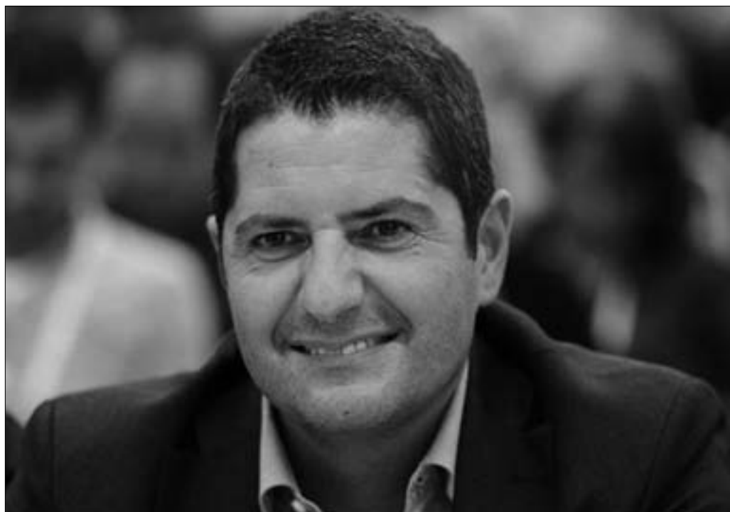
Fig. 1. Una foto del sindacalista Marco Bentivogli della FIM (Federazione Italiana Metalmeccanici) CISL (Confederazione Italiana Sindacati Lavoratori) che nel 1997 ebbe l'idea di realizzare il "Progetto intergenerazionale: le radici e le ali" finalizzato a far lavorare assieme in armonia giovani e anziani.

Il risultato delle cinque giornate di esperimenti è il seguente. L'unico modo per fare lavorare assieme giovani e anziani è quello di trovare un progetto in comune. Significa non mettere troppo in evidenza le capacità di un singolo, bensì quelle del gruppo come totalità, dove ognuno deve sentirsi orgoglioso di quello che sta facendo, poiché il singolo ha dei limiti, ma il gruppo non ha limiti.