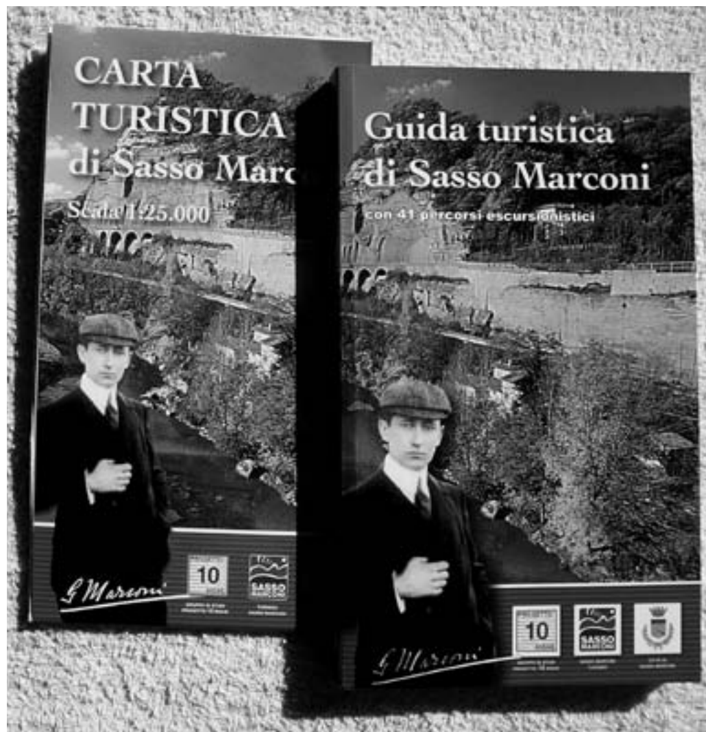
Fig.12. Copertina della "Guida turistica di Sasso Marconi" con allegata la "Carta turistica di Sasso Marconi" in scala 1:25.000: un volume di 304 pagine a colori, con 17 monografie di approfondimento e la descrizione di 41 percorsi escursionistici, pubblicato dal Gruppo nel 2005.

Comune. E' nato un volume di 304 pagine a colori, con 17 monografie di approfondimento, la descrizione di 41 percorsi escursionistici, con allegata la cartografia del territorio in scala 1:25.000 (Fig.12).