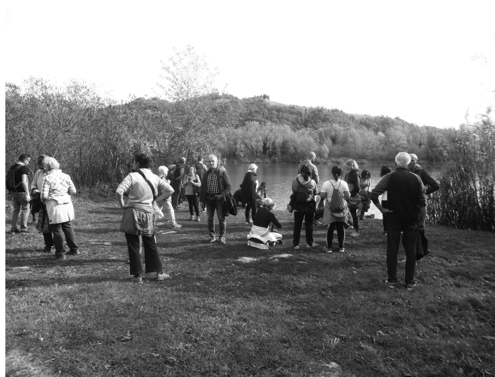
Fig. 11. Martedì 1 novembre 2022: “Tartutrek”, trekking alla scoperta della storia e dei luoghi meno conosciuti di Sasso Marconi in occasione della Tartufesta 2022. Una sosta del gruppo ai laghetti di Porziola.

Da giugno a dicembre 2022: partecipazione alle riunioni della Consulta per l'Escursionismo di Bologna (referenti Rino Ruggeri e Luigi Ropa Esposti)