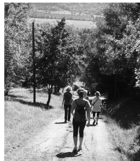
Fig. 4. Sabato 10 settembre 2022: escursione alla scoperta delle colline marconiane in occasione della presentazione del progetto “Marconi pop”. Il gruppo sulle colline di Pontecchio.

Domenica 18 settembre 2022: “A passo di musica”; visita guidata alla Casa della Natura e all’Oasi naturale di San Gherardo, seguita dal concerto “Acustica latina” con Sergio Fabian Lavia e Dilene Ferraz (in collaborazione con Ecosistema e Le Rossignol) (referente Luigi Ropa Esposti) (Fig.7)