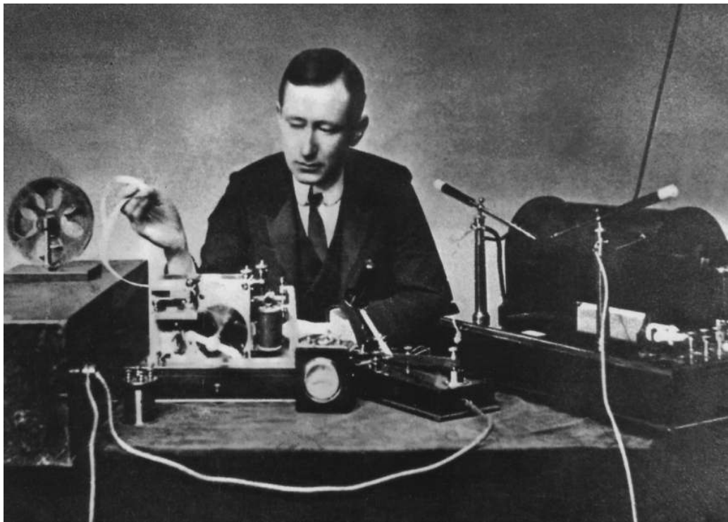
Fig.4. Un giovane Guglielmo Marconi con uno dei suoi primi apparati radio alla fine dell'800.

Nella sua poliedrica ed incessante attività Tesla si procurò numerosi brevetti (circa 300), alcuni dei quali si estendevano al campo radio in modo ancillare. La cosa più vicina