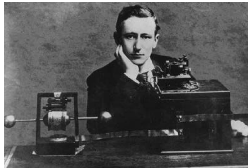
Fig.4. 2 luglio 1897 (120 anni fa): a Londra Guglielmo Marconi ottiene il brevetto n. 12039 per la sua invenzione, che rende possibili le comunicazioni senza fili via onde radio. Questa è la foto storica che ritrae il giovane inventore (ha solo 23 anni) accanto al trasmettitore a scintille (a sinistra) e al ricevitore, entrambi muniti di antenne.