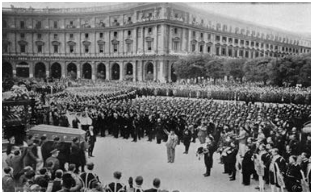
Fig.1. 21 luglio 1937 (80 anni fa): a Roma si svolgono i funerali di Stato per Guglielmo Marconi, deceduto nella notte fra il 19 e il 20 luglio per una crisi cardiaca. Il corteo accompagna il feretro dalla Farnesina alla chiesa di Santa Maria degli Angeli.