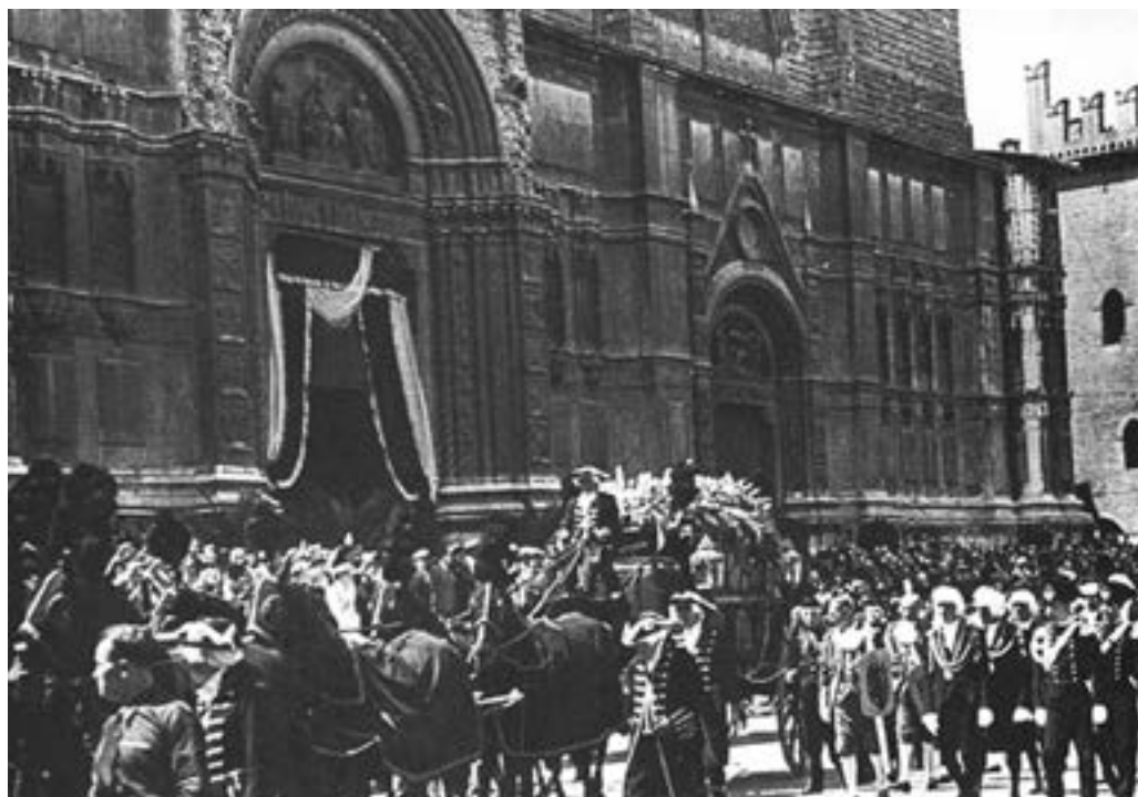
Fig.2. 23 luglio 1937: Bologna, sua città natale, tributa gli onori a Guglielmo Marconi con funerali di Stato. Nella foto il mesto corteo davanti alla Basilica di San Petronio (immagine tratta dal web: www.radiomarconi.com/marconi/storia2.html ).