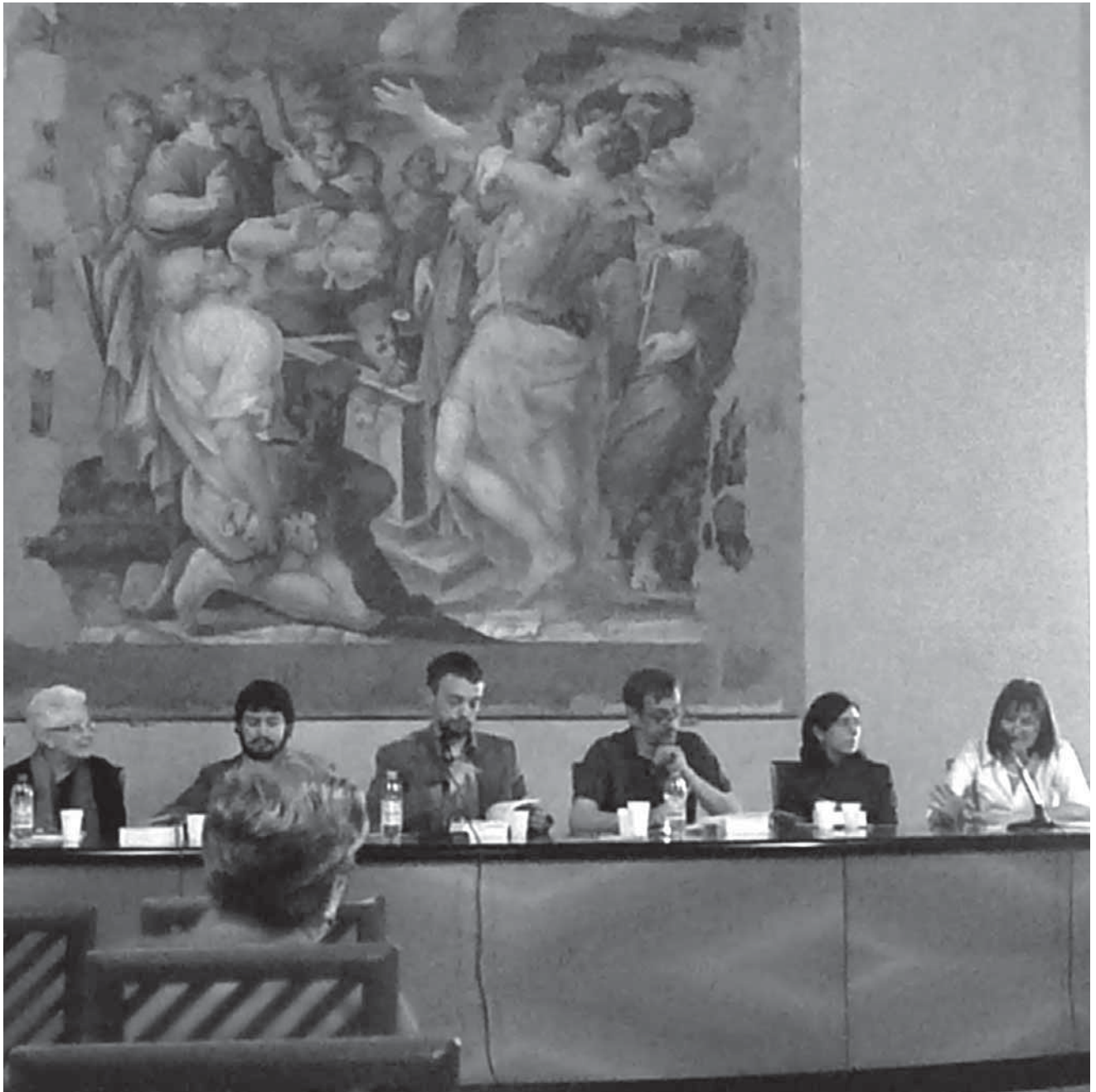
Fig. 2 Bologna, Palazzo D'Accursio 15 aprile 2009: la presentazione del volume in Cappella Farnese

si apre con un denso saggio di R. Ferretti ( Quale sviluppo per l'Appennino? Le vie della modernizzazione economica nella montagna tra Idice e Reno ), in cui l'autore passa in rassegna i diversi “percorsi