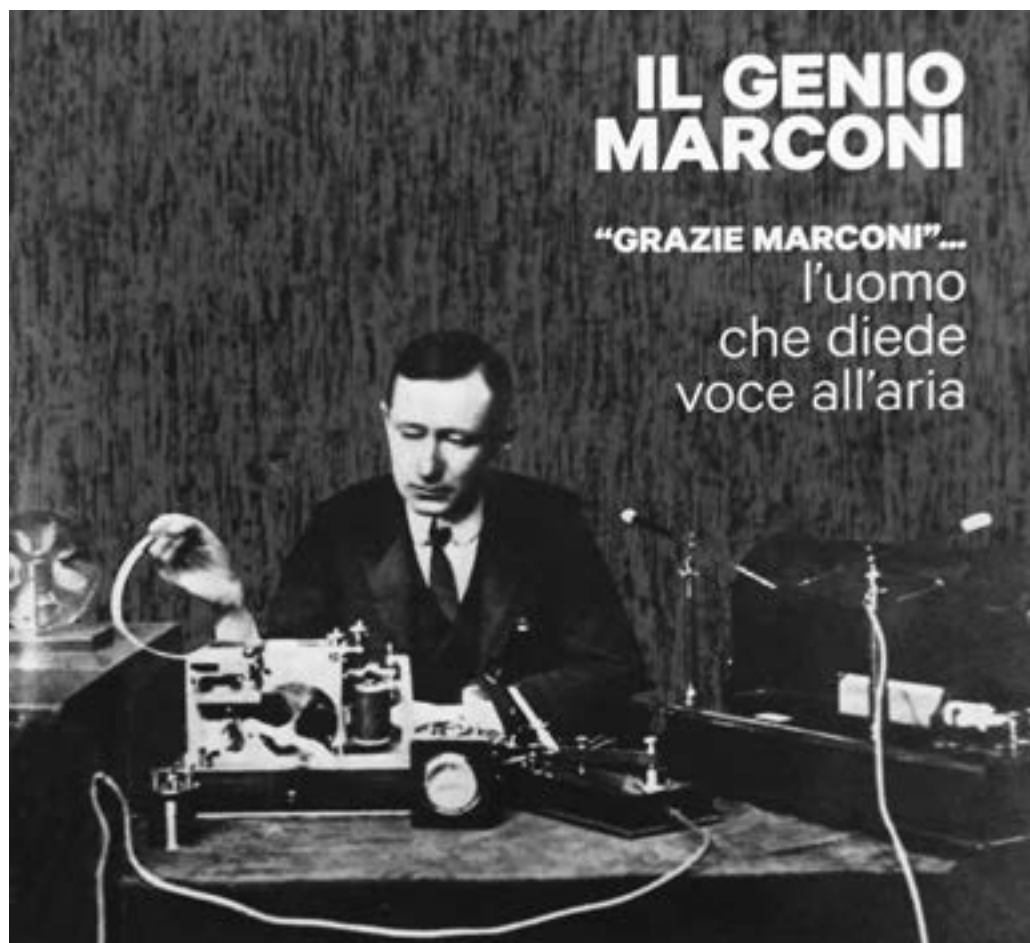
Fig.4. Nel corso della mostra “Il Genio Marconi”, tenutasi presso la Prefettura di Bologna dal 17 al 28 febbraio, accanto alle antiche apparecchiature radio sono stati esposti anche gli appunti e i quaderni del giovane Guglielmo prestati per l'occasione dall' Accademia dei Lincei di Roma.

espositivo che ha inizio dalle onde radio di Marconi per proseguire con la fonografia di Edison, il telefono di Meucci, il cinema dei fratelli Lumière, il computer di Jobs...fino ad un angolo dedicato alla filatelia e al collezionismo. Nell'occasione è stata emessa una cartolina con annullo filatelico a cura del Circolo Filatelico “Guglielmo Marconi” di Sasso Marconi.