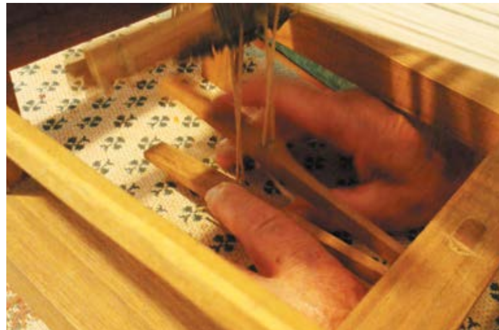
Fig. 17. I kéiquai (particolare del telaio) (proprietà Elio Pagani).