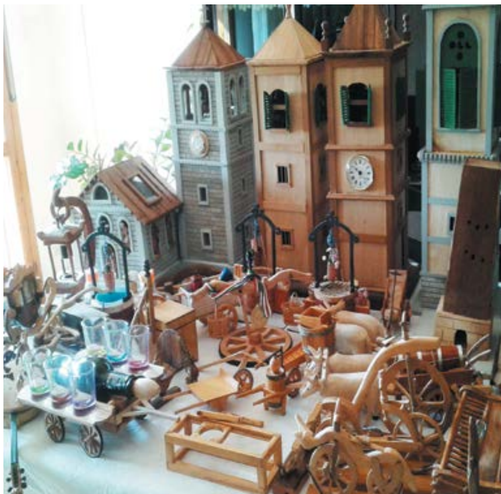
Fig.12. Vari oggetti in miniatura. In primo piano da destra: carro bolognese, spasàdg (antico passeggino per insegnare a camminare ai bambini) e carro porta-bicchieri (proprietà Elio Pagani).