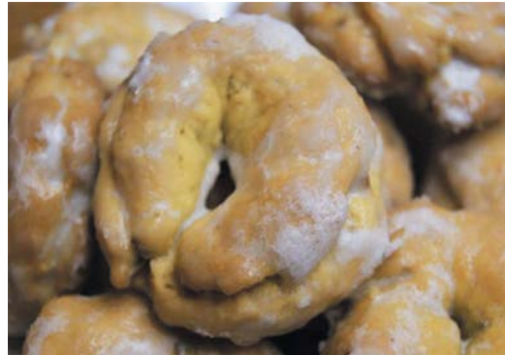
Fig.2. Lo "Zuccherino montanaro", un biscotto dalla forma arrotondata con il buco nel mezzo, guarnito da una colata di zucchero bianco.

Le origini dello "Zuccherino montanaro" sono nell'Appennino Bolognese, e risalgono ad un tempo lontano, di vita non facile, scandita da ritmi ben precisi, dove i mezzadri di montagna avevano difficoltà a reperire i cibi per le proprie famiglie, di una cultura contadina legata al grano e alle castagne, prodotti poveri. Sia