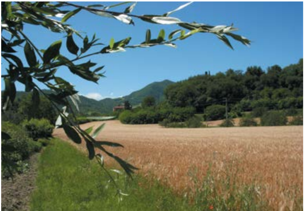
Fig.1. Il contadino è colui che deve gestire e curare, nel bene e nel male, l'ambiente che ci circonda. Nella foto un campo coltivato a grano in località Pian di Venola (Marzabotto).

molto ampio, all'interno del quale trovano spazio diversi temi quali: l'agricoltura, l'ambiente, l'agroforestale, la fauna selvatica, l'allevamento, l'agroalimentare, le tradizioni, gli antichi mestieri, la