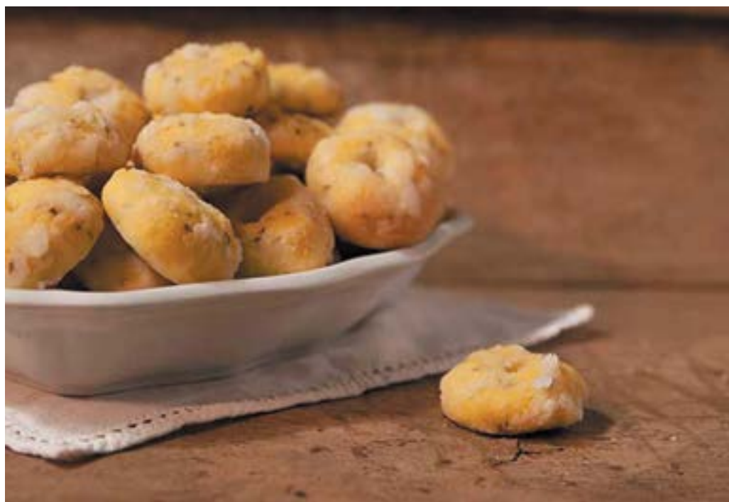
Fig.3. Lo "Zuccherino castiglione", simbolo di una tradizione contadina e montanara, dal 2016 è diventato un prodotto a marchio DeCO (Denominazione Comunale d'Origine).