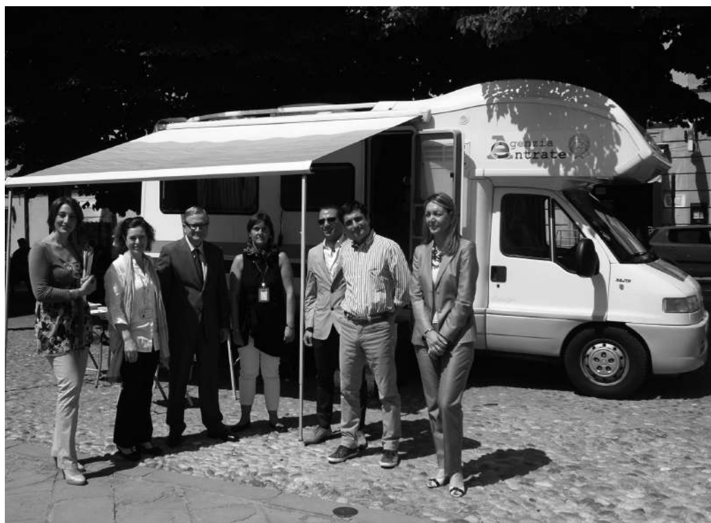
Fig.7. Giugno 2014: il camper dell'Agenzia delle Entrate in Piazza dei Martiri.

catastale, ottenere informazioni su donazioni e successioni, chiarimenti su irregolarità e iscrizioni a ruolo o semplicemente per richiedere l'emissione del codice fiscale o della partita Iva. Quella di Sasso era l'ultima tappa di un tour partito a maggio, che ha visto l'ufficio mobile dell'Agenzia delle Entrate toccare altri 4 comuni del Piemonte e della Lombardia, con l'obiettivo di facilitare gli adempimenti fiscali dei cittadini che risiedono nelle località più lontane dagli uffici territoriali dell'Agenzia. Un'iniziativa che ha incontrato l'apprezzamento dei nostri concittadini (Fig. 7).