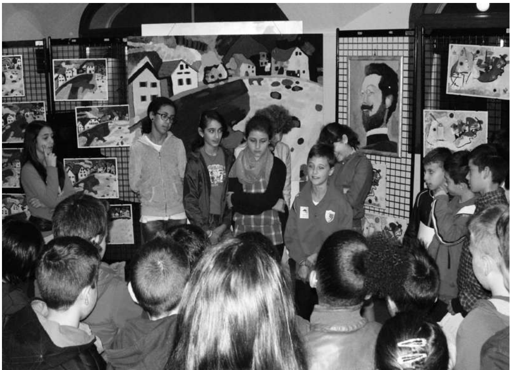
Fig.5. maggio 2014: i ragazzi di 5ª B della scuola elementare Villa Marini all'inaugurazione della mostra di pittura dedicata a Paul Gauguin.