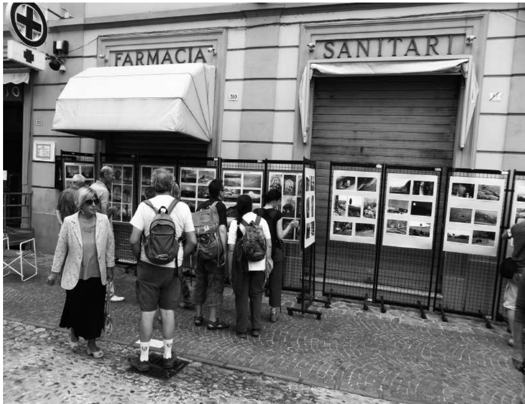
Fig.10. 29 giugno 2014: la mostra fotografica “I nostri sentieri” in Piazza dei Martiri.