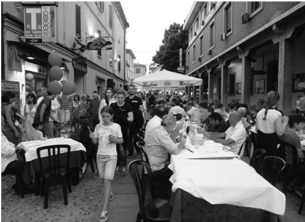
Fig.8. 23 giugno 2014: via Porrettana durante la Notte Blu.

Ma musica dal vivo ed esibizioni di ballo hanno animato tutti gli angoli del paese, addobbati per l'occasione di decorazioni e palloncini blu. Una torta blu gigante, distribuita a tutti i presenti, ha suggellato nel migliore dei modi una piacevole serata di festa (Fig. 8).