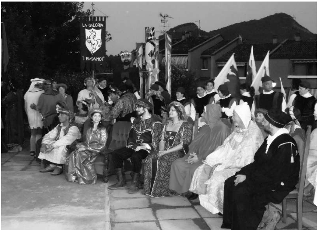
Fig.9. 27 giugno 2014: la rievocazione medievale al Borgo di Fontana.

si è aperta con un corteo storico in costume, e ha avuto il suo momento culminante nella ricostruzione di un'investitura cavalleresca (nello specifico quella di Sante Bentivoglio), accompagnata dal giuramento di fedeltà dei cavalieri di Fontana alla contessa Nicolosa. Alla cerimonia di investitura hanno fatto da sfondo duelli e disfide tra armigeri, danze e balli d'epoca, il Palio delle Contrade (con giochi medievali per bambini), il mercatino storico, le esibizioni di giocolieri e di un applaudito lanciatore di coltelli: tanti eventi che hanno contribuito a far rivivere l'atmosfera e le situazioni di fine '400 (Fig. 9).