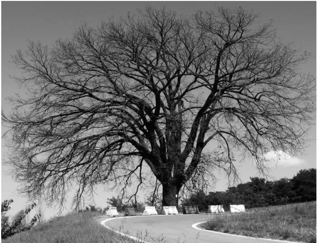
Fig. 11. 11 luglio 2014: la quercia secolare, posta sulla strada provinciale di Badolo, poco prima del suo abbattimento a causa del completo disseccamento.

dai tecnici del Comune, della Provincia e del Servizio Fitopatologico Regionale, non hanno potuto che constatare il perdurare delle condizioni critiche della pianta e della impossibilità di porre alcun rimedio al suo disseccamento. Non è stato inoltre ancora possibile accertare le cause della malattia. Essendo la pianta collocata a margine della strada provinciale, per evitare pericoli di schianto o di caduta dei rami sugli autoveicoli, le autorità sono state costrette a provvedere al suo abbattimento. Non poche lacrime sono state versate da chi l'aveva ammirata per anni (Fig. 11).