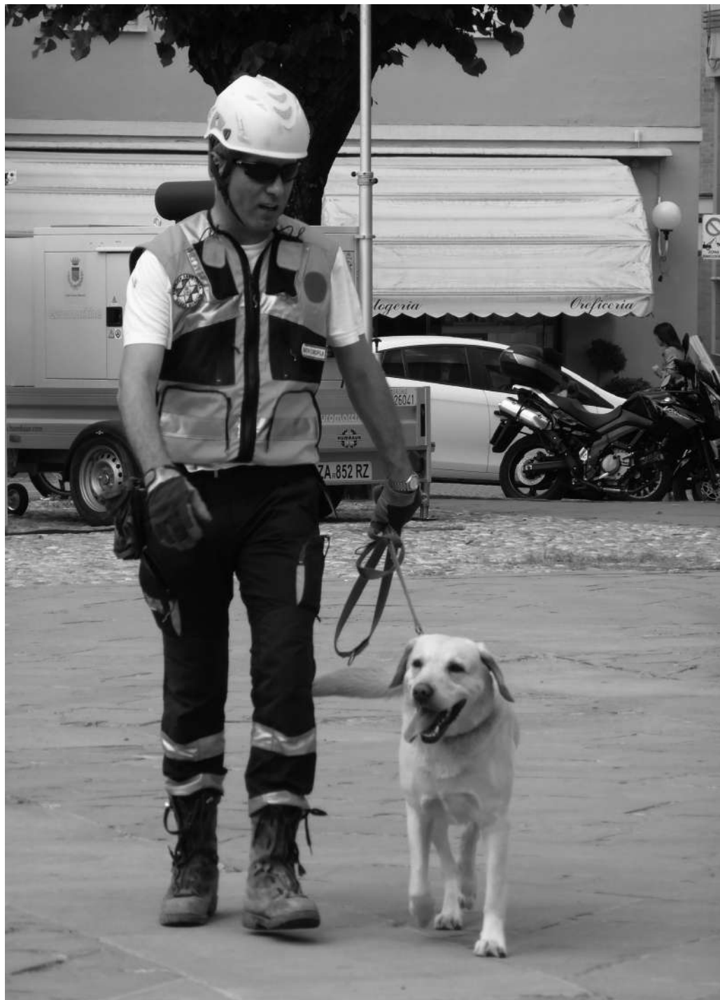
Fig.4. 18 maggio 2014: una unità cinofila di soccorso durante l'esercitazione di Protezione Civile che si è svolta in Piazza dei Martiri a Sasso Marconi.