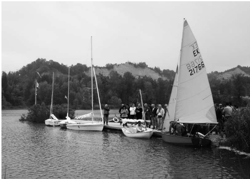
Fig.3. 27 aprile 2014: un momento dell'inaugurazione del centro nautico al lago di Porziola.

E se i bambini hanno potuto familiarizzare con un animale da sempre presente nell'immaginario dei più piccini, partecipando ai laboratori creativi promossi per l'occasione, la mostra fotografica "Il mondo del lupo" ha offerto a tutti i partecipanti l'opportunità di apprezzare la bellezza di questo affascinante predatore, 'immortalato' nel proprio habitat naturale dai fotografi di "Provediemozioni.it".