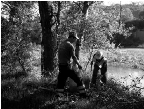
Fig.7. 6 ottobre 2012: "Puliamo il Mondo" edizione 2012; alcuni volontari durante le operazioni di pulizia dai rifiuti delle sponde del Reno presso i laghetti di Porziola.

"Guglielmo Marconi tra storia e leggenda: un patrimonio da valorizzare" . Questo il titolo della conferenza che si è tenuta il 12 ottobre a Villa Griffone nell'ambito