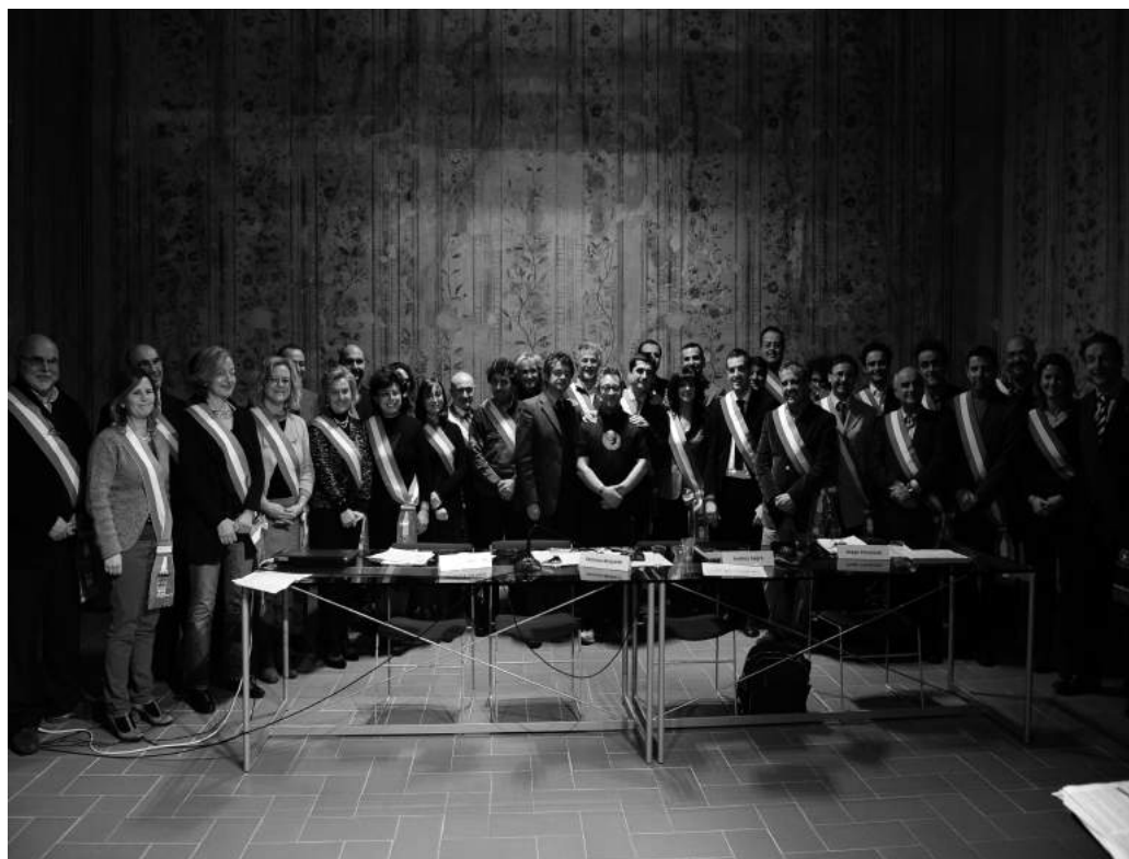
Fig.10. 7 dicembre 2012: i Sindaci dell'Emilia Romagna che nel Salone delle Decorazioni di Colle Ameno hanno sottoscritto il patto contro lo spreco alimentare.

Il 7 dicembre, il Borgo di Colle Ameno ha ospitato una serie di eventi dedicati alla lotta contro lo spreco, al rispetto dell'ambiente e alle buone pratiche. La mattinata si è aperta con il Forum di Economia Solidale del Distretto di Casalecchio di Reno, in cui si è discusso di economia in tempo di crisi e di alternative solidali, presentando le esperienze maturate sul territorio distrettuale. Nel pomeriggio si è svolta la cerimonia della firma