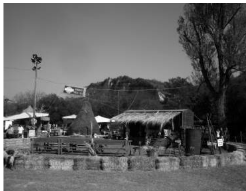
Fig.3. 8 settembre 2012: l'area agricola dell'edizione 2012 della Fira di Sdaz (foto Ufficio Stampa Comune di Sasso Marconi). Fig.3. 8 settembre 2012: l'area agricola dell'edizione 2012 della Fira di Sdaz (foto Ufficio Stampa Comune di Sasso Marconi).

Apple e Android, hanno così potuto consultare il programma della "Fira di Sdaz", conoscerne la storia e scoprire curiosità e aneddoti sull'ultracentenaria manifestazione. Insomma, un tocco di modernità nel contesto di una manifestazione legata alle tradizioni contadine di un tempo: tradizioni che alla Fiera continuano a rivivere attraverso la riproposizione degli antichi mestieri, degli attrezzi agricoli, dei balli e dei canti popolari, dei tarocchi bolognesi, delle gare di abilità tra i trattori, e attraverso la ricostruzione della Fattoria, ovvero dell'ambiente colonico in cui viveva la famiglia contadina con i suoi arnesi, gli animali domestici, i balli nell'aia, le antiche ricette. Una formula che, a distanza di tre secoli, conserva intatto il proprio fascino e continua ad essere apprezzata dai visitatori (Fig.3).