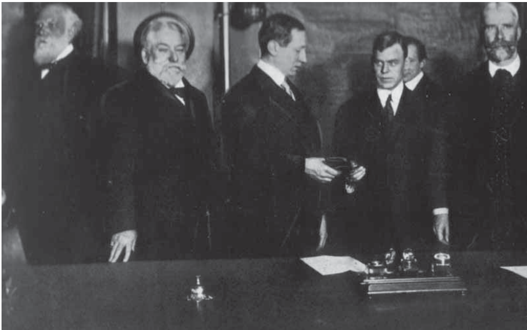
FIG. 3. Primo periodo inglese 1896 -1901. Guglielmo Marconi in Inghilterra mentre presenta uno dei suoi esperimenti

Nel 2008 è stato eseguito l'inventario dell'intero, imponente archivio, e messo in rete, per la gioia dei ricercatori. In realtà non fu donato solo l'archivio ma l'intera "Marconi Collection", comprendente anche un notevole numero di oggetti, ora nel Museo di Storia del-