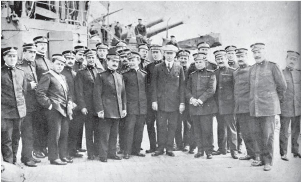
FIG. 4. Marconi e la Marina Militare Italiana. Marconi a bordo di una unità della Marina Militare Italiana nel 1914

Sono stati individuati, in particolare, 24 percorsi (questo schema potrà subire variazioni in base all'evolversi delle ricerche).