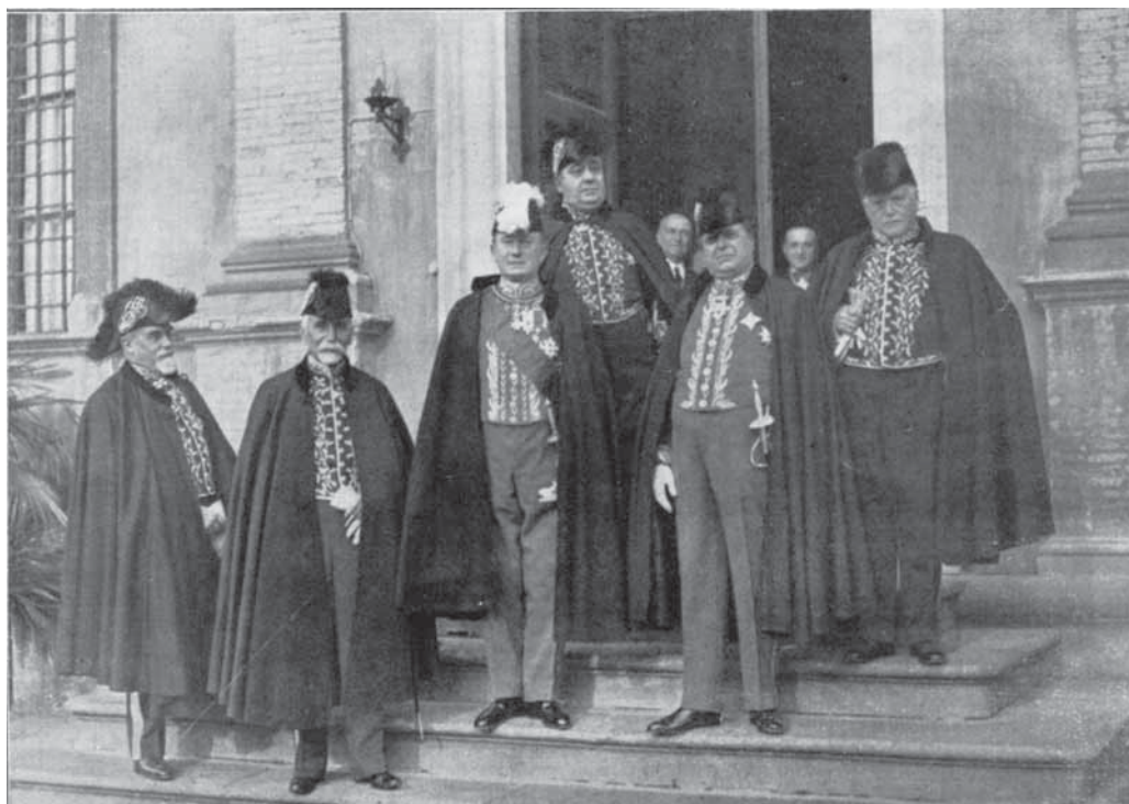
FIG. 1. Marconi, al centro, con personalità della Reale Accademia d'Italia , Roma 1930