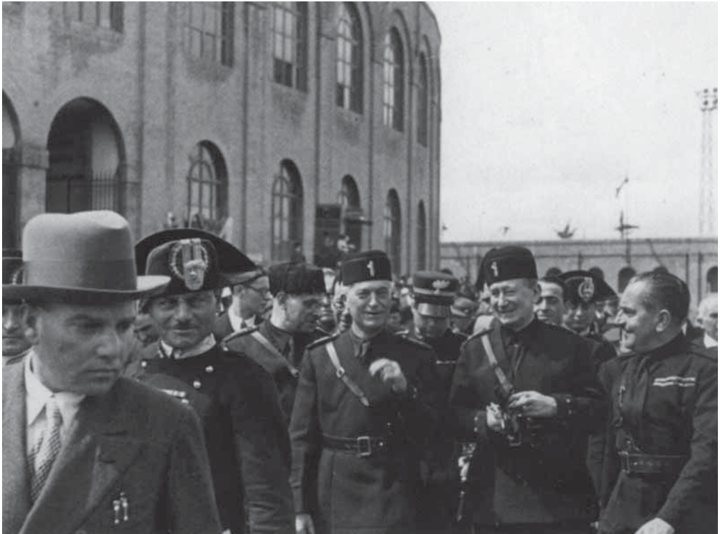
Fig. 7. Marconi e il fascismo. Marconi col podestà di Bologna Angelo Manaresi inaugura la Fiera del Littoriale, 5 maggio 1934

oggi basata solo su una conoscenza indiretta, attraverso l'inventario messo in rete. È questa una prima lacuna, da colmare a breve.