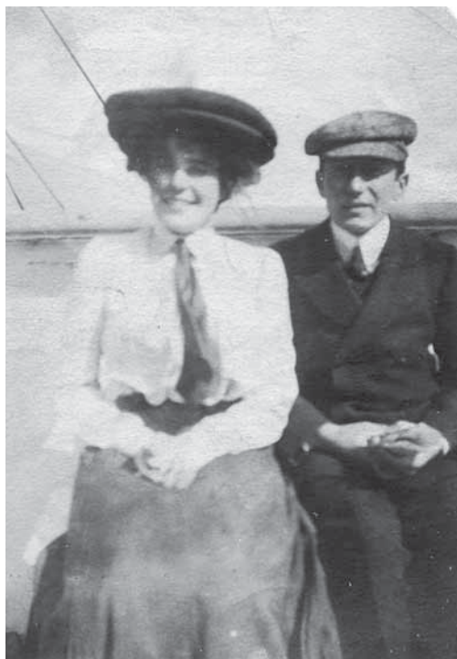
FIG. 6. Vita privata: Guglielmo Marconi con la moglie Beatrice O'Brien, 1910 circa

1904-14”; Serie A.8.3 “Other sea disasters and rescues, 1909-34”; Serie B.13.1 (Mss. 1795-1796).