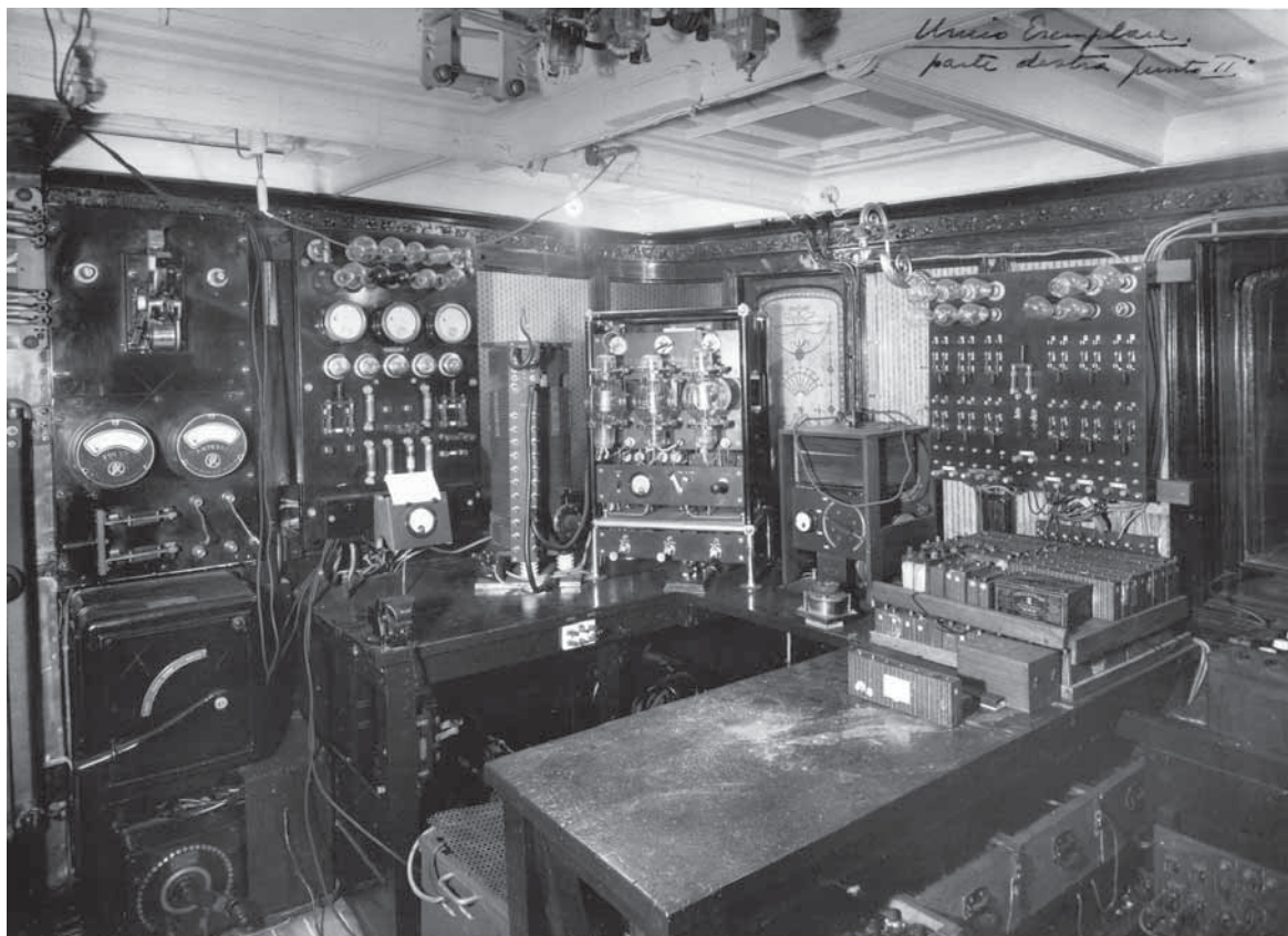
FIG. 5. Panfilo Elettra. Gli impianti installati da Marconi all'interno dell'Elettra dopo il suo acquisto nel 1919

Nell'Archivio Notarile (presso l'Archivio di Stato di Bologna) è possibile rintrac-