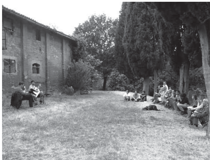
FIG. 5) sabato 20 giugno 2009 : escursione notturna con concerto ai Prati di Mugnano. Il concerto al tramonto per chitarra e mandolino sull’aia del podere “la Piazza”