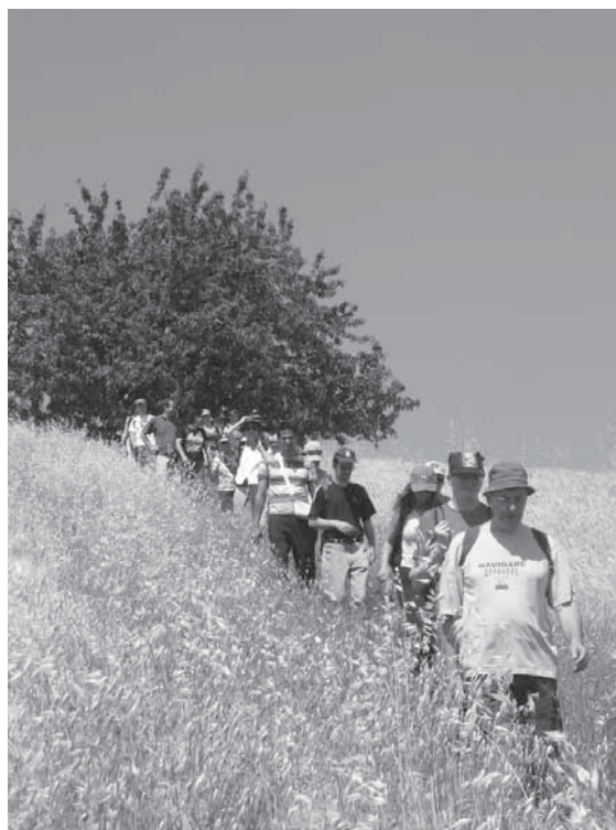
FIG. 4. domenica 14 giugno 2009 : escursione “Sull’onda di Marconi”. Il gruppo mentre discende dalla collina dei Celestini, dove il giovane Marconi compì i primi esperimenti